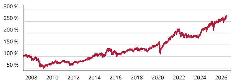
— Amundi Funds Global Equity Responsible A