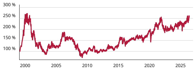
— Fidelity Funds - Japan Equity ESG Fund A