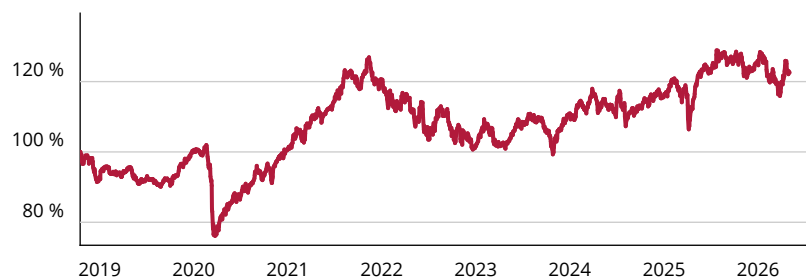
— Frankfurter Aktienfonds für Stiftungen C