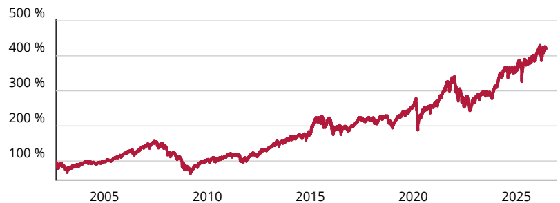
— ODDO BHF Algo Sustainable Leaders CRW